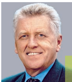
Ernst Pfister MdB Wirtschaftsminister des Landes Baden-Württemberg